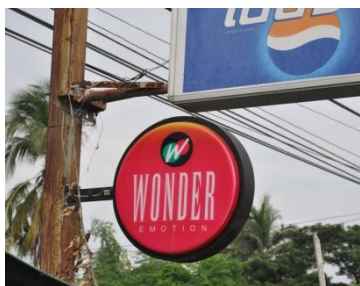
การโฆษณาบุหรี่ที่ห้อวันเดอร์

- ห้ามโฆษณาผลิตภัณฑ์ยาสูบหรือแสดงชื่อหรือเครื่องหมายผลิตภัณฑ์ยาสูบในสิ่งพิมพ์ทางวิทยุกระจายเสียง วิทยุโทรทัศน์ หรือสิ่งอื่นใดซึ่งใช้เป็นการโฆษณาได้ หรือใช้ชื่อหรือเครื่องหมายของผลิตภัณฑ์ยาสูบในการแสดง การแข่งขัน การให้บริการหรือการประกอบกิจกรรมอื่นใดที่มีวัตถุประสงค์ให้สาธารณชนเข้าใจว่าเป็นชื่อหรือเครื่องหมายของผลิตภัณฑ์ยาสูบ (มาตรา ๘ วรรคหนึ่ง) บทบัญญัติดังกล่าวมิให้ใช้บังคับกับการถ่ายทอดสดรายการจากต่างประเทศทางวิทยุโทรทัศน์ และการโฆษณาผลิตภัณฑ์ยาสูบในสิ่งพิมพ์ซึ่งจัดพิมพ์นอกราชอาณาจักร โดยมีได้มีวัตถุประสงค์ให้นำเข้ามาจำหน่ายจ่ายแจกในราชอาณาจักร (มาตรา ๘ วรรคสอง)