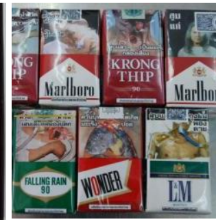
ซิการ์เรต

- ห้ามขาย แลกเปลี่ยน หรือให้ผลิตภัณฑ์ยาสูบแก่บุคคลอายุต่ำกว่า ๑๘ ปี (มาตรา ๔) นอกจากนี้จะเป็นความผิดตามมาตรา ๒๖ พระราชบัญญัติคุ้มครองเด็ก พ.ศ. ๒๕๔๖ ด้วย