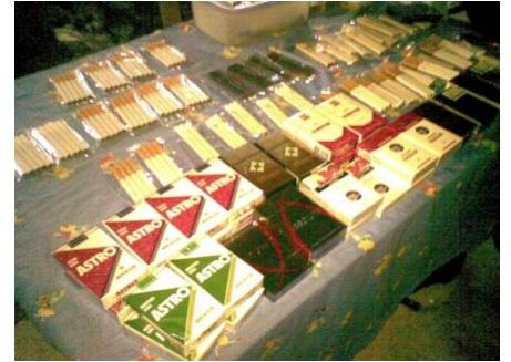
บุหรี่ยีการ์แรตที่ไม่มีภาพค่าเตือน