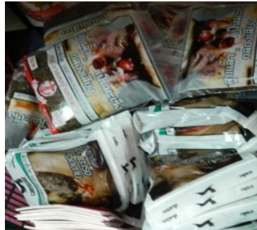
ยาเส้นที่มีภาพค่าเตือน ๔ สี ๕๕%