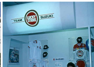
การโฆษณาบุหรี่ที่ห้อลัคกี้สไตรท์