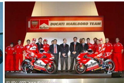
การโฆษณาบุหรี่ที่ห้อมาลโบโล