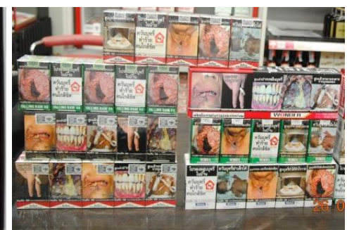
ยีการ์แรต

- “สูบบุหรี่ยี” หมายความว่ารวมถึงการกระทำใดๆ ซึ่งมีผลทำให้เกิดควันจากการเผาไหม้ของบุหรี่ยี