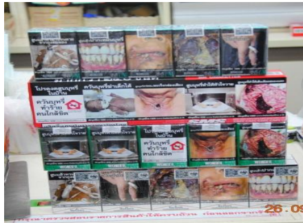
บุหรีชิกาเรต ภาพคำเตือนใหม่ (ขนาด ๘๕%) ที่บังคับใช้ในปัจจุบัน

ตามประกาศกระทรวงสาธารณสุข เรื่อง หลักเกณฑ์ วิธีการและเงื่อนไขการแสดงรูปภาพ ข้อความคำเตือน เกี่ยวกับพิษภัยและช่องทางติดต่อเพื่อการเลิกยาสูบ ในฉลากของบุหรีชิกาเรต พ.ศ. ๒๕๕๖