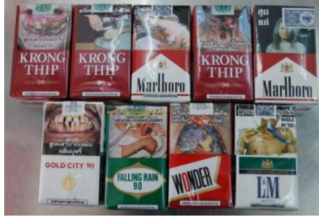
บุหรีชิกาเรต ภาพคำเตือนเก่า (ขนาด ๕๕%) ยกเลิกแล้ว