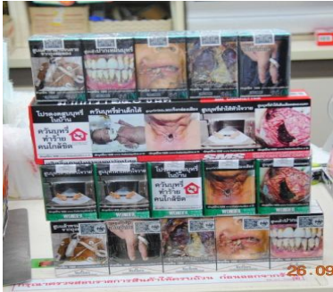
บุหรี่ยีการ์แรตที่มีภาพค่าเตือน ๘๕%

- ผลิตภัณฑ์ยาสูบที่จะขายได้ต้องมีภาพและข้อความค่าเตือนตามกฎหมาย (มาตรา ๑๓) กรณีการขายบุหรี่ซิการ์แรตแบ่งใส่ซองหรือหีบห่อที่ไม่มีภาพค่าเตือนเกี่ยวกับโทษและพิษภัยตามกฎหมาย ถือว่าเป็นความผิดตามมาตรา ๑๓ ซึ่งต้องพิจารณาจากประกาศเกี่ยวกับข้อความภาพค่าเตือนของผลิตภัณฑ์ยาสูบ ชนิดนั้นๆ ว่าต้องทำอะไร เช่น ในปัจจุบัน ยาเส้นที่จะขายได้ บนซองหรือหีบห่อต้องมีภาพค่าเตือน ๔ สี ๔ แบบ โดยภาพค่าเตือนมีขนาด ๕๕ % เป็นต้น