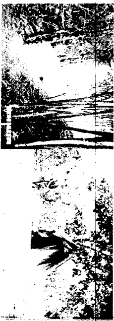
หลวงพ่อมหาเถรเทศ ปุณฺณโก