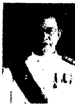
๑๒. นายธีรภัทร์ เสรีรังสรรค์ อดีตรัฐมนตรี ประจำสำนักนายกรัฐมนตรี