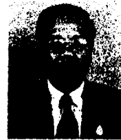
๖. นายเฉลิมพล เอกอรู อดีตรองปลัดกระทรวงการต่างประเทศ