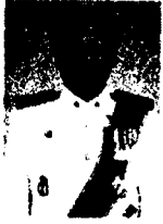
๑. นายสามารถ ศรียานงค์ อดีตรองเลขาธิการสภาความมั่นคงแห่งชาติ