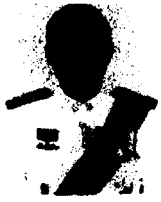
๗. นายจงเต็ง อินสว่าง อดีตรองปลัดกระทรวงการท่องเที่ยวและกีฬา