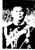
๓. พลโท เดชพันธ์ ดวงรัตน์ อดีตผู้ทรงคุณวุฒิพิเศษ กองบัญชาการทหารสูงสุด